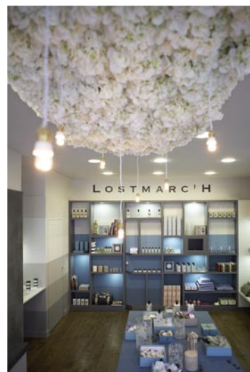
Boutique, 17 rue Hoche à Rennes

Le terme de "design" est en effet aujourd'hui galvaudé, sujet à toutes les récupérations d'image mettant la confusion dans l'esprit de nos contemporains. Il faut se rappeler que le mot anglo-saxon prononcé [di.zajn], tire son étymologie du français dessein lui-même d'origine latine designare. À partir du XVIII e siècle, les mots "dessin" et "dessein" prennent une graphie et des sens distincts, comme si, dans la langue de Molière, l'art avait fini par séparer le geste (dessin) du projet (dessein). Le design signifie donc à la fois d'une part projeter, avoir une intention, conceptualiser et d'autre part réaliser, construire, fabriquer.