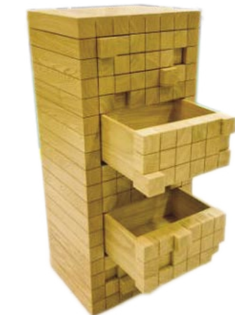
Meuble EKO © Erwan PERRON - Designer : Erwan PERRON Entreprise : Pepion Agencement Menuiserie