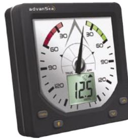
WIND-a / girouette analogique

Le projet est piloté par Bretagne Innovation qui