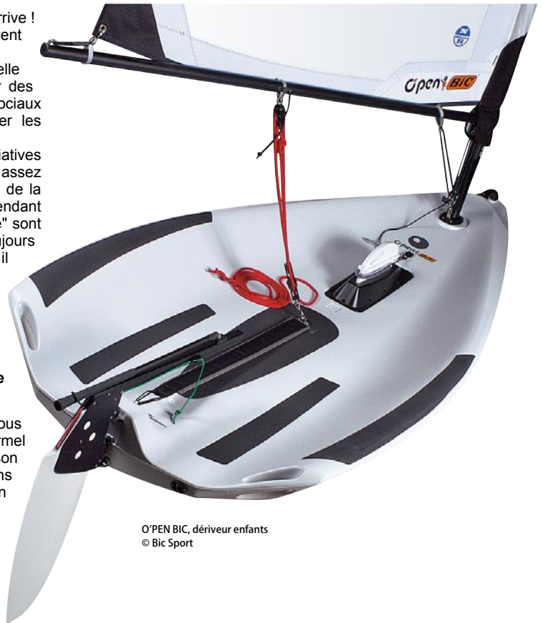
O'PEN BIC, dériveur enfants

Liens : www.habitat-creation-bretagne.fr